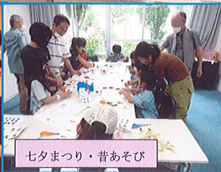
七夕まつり・昔あそび